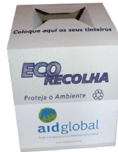
Junte-se a esta iniciativa e traga os seus tinteiros até à AIDGLOBAL

Este tem sido o grande desafio de Portugal. Este tem sido, também, o desafio e o propósito da AIDGLOBAL, ao pôr à disposição dos imigrantes do concelho, uma formação que passa não só pela aprendizagem da língua, mas se complementa com o apoio informativo e a orientação profissional.